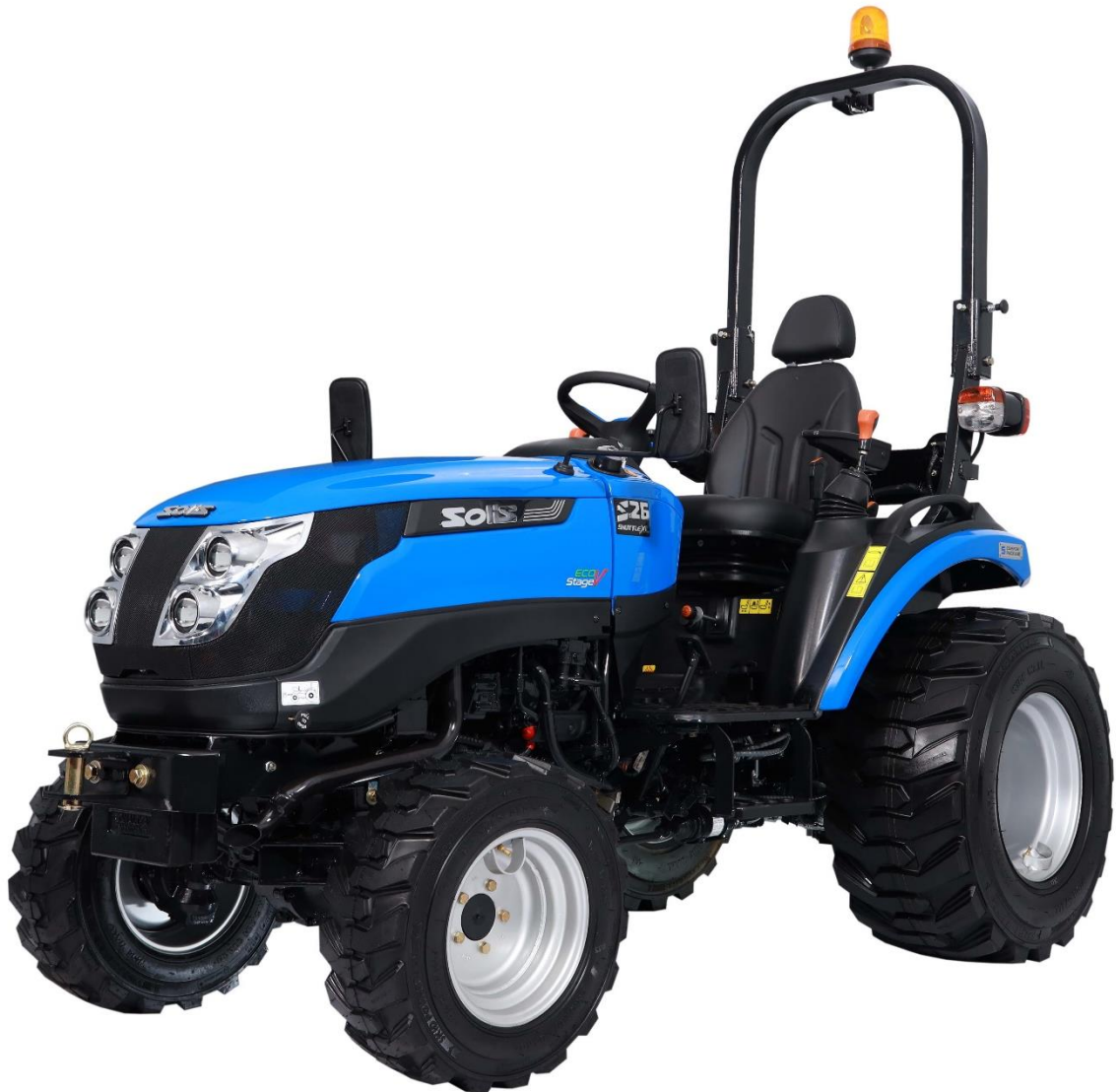
SOLIS MODEL 26