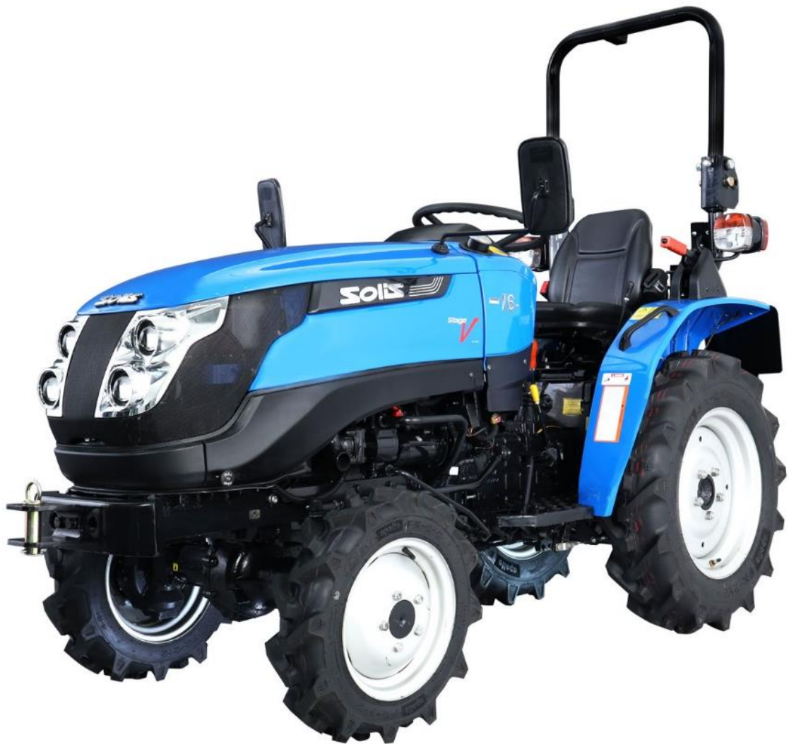
SOLIS MODEL 16