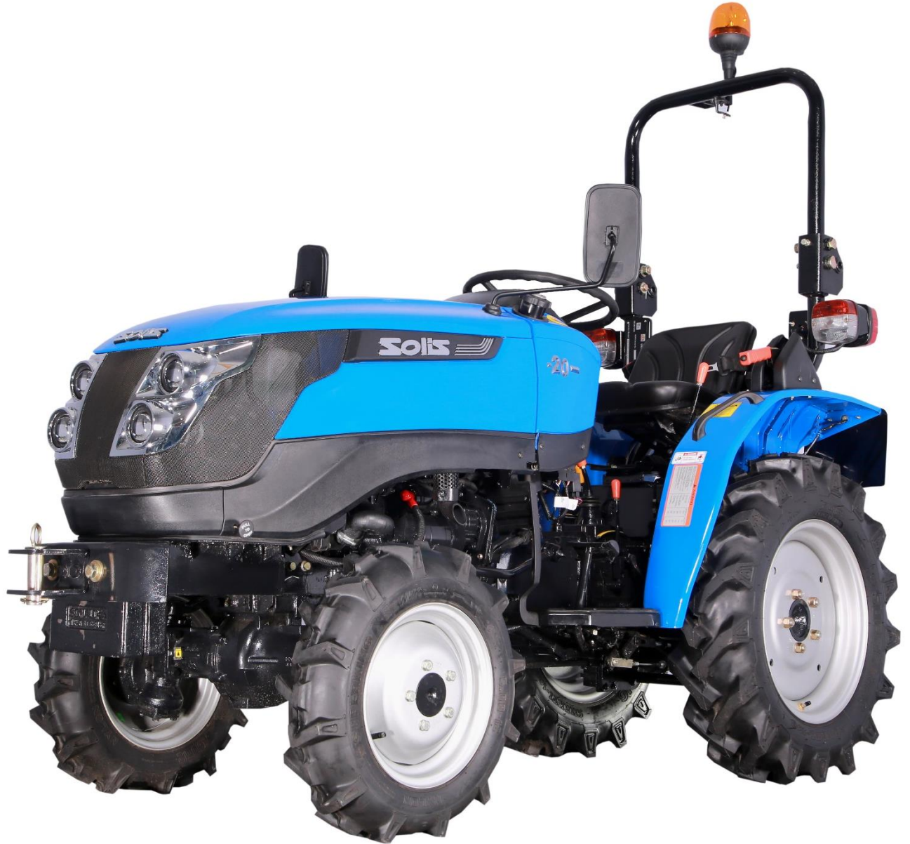
SOLIS MODEL 20